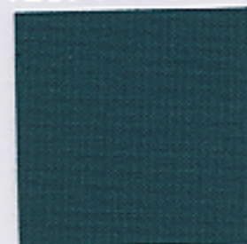
1206 (ティーフグリーン)