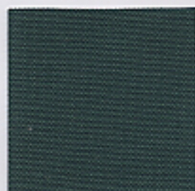
6707 (フォレストグリーン)