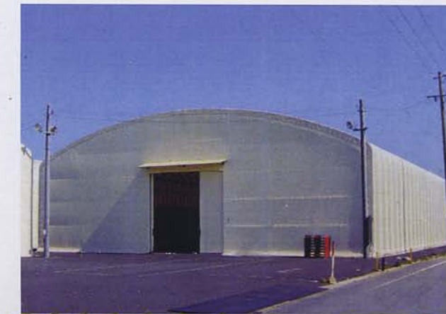
施工例：テント倉庫