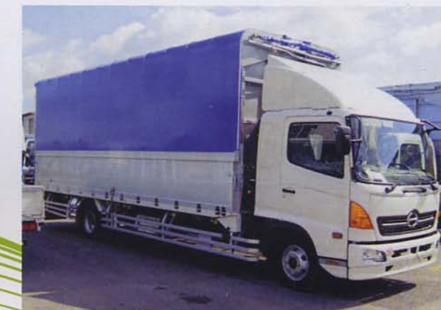
施工例：トラック被