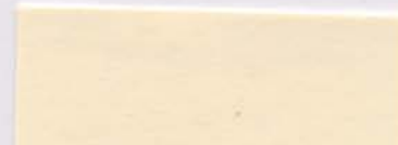
2Mライトアイボリー